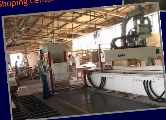
Proizvodnja namještaja / Production of furniture