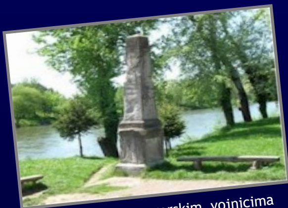
Spomenik austro-ugarskim vojnicima na obali rijeke Bosne / Monument to the Austro-Hungarian soldiers on the bank of river Bosna