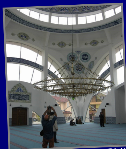
Unutrašnjost nove "Vali Recep Yazicioglu" gradske džamije / Interior of the new "Vali Recep Yazicioglu" mosque.

Uzeirbegov konak je izuzetno lijep objekat, uz samu obalu rijeke Bosne. Sagrađen u starobosanskom stilu XIX vijeka, negdje oko 1875. godine. Konak je sagradio jedan od potomaka maglajskih kapetana Salih-beg Uzeirbegović. Konak je bio poznat po tome što je njegov vlasnik svojim gostima pružao besplatan konak i hranu. / Uzeir Bey's dormitory is a very nice building, close to the river Bosna. Built in old bosnian style of the nineteenth century, somewhere around the 1875th year. The Dormitory was built by one of the descendants captain Salim Bey Uzeirbegović. It was known to offer its guests free meals and beds to rest.