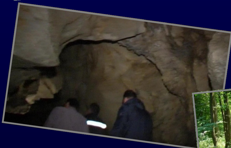
Unutrašnjost pećine Megare / Inside of cave Megara

Pećina Megara se nalazi u blizini naselja Donji Rakovac, općina Maglaj. Za sada prema nekim speleološkim istraživanjima njena dužina iznosi oko 2500 m . Dijeli se na suhu i mokru Megaru ovisno o tome da li je potopljena vodom ili nije. U pećini obitava i endemična vrsta bijelog pauka. / Megara cave is located near village Donji Rakovac, municipality of Maglaj. For now, according to some caving research its lenght is about 2500 meters. It is divided into dry and wet Megara dependind on whether or not flooded with water. An endemic species of spiders can also be found inside of the cave.