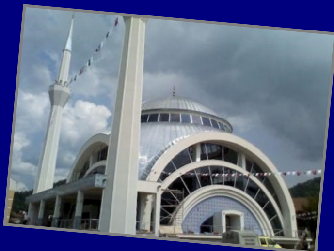
Nova gradska "Vali Recep Yazicioglu" džamija u novom dijelu grada Maglaja svečano otvorena 15. augusta 2009. godine / New "Vali Recep Yazicioglu" mosques in the new part of Maglaj officially opened on August 15. 2009.