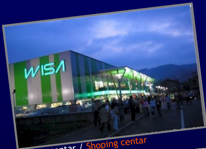
Šoping centar / Shopping center

Prije rata okosnicu maglajske privrede je činila kompanija „Natron“ kao najveći proizvođač celuloze i papira na Balkanu. Danas je Natron privatiziran od strane turske kompanije „Kastamonu entegre“ koja je investirala preko 100 miliona € u pokretanje proizvodnje. Trenutno je registrovano i oko 700 obrta i drugih malih i srednjih preduzeća koje se bave raznim djelatnostima (proizvodnja namještaja, tekstilna industrija, proizvodnja građevinske stolarije, prerada mlijeka i mliječnih proizvoda, metalna industrija, građevinska industrija, drvo-prerađivačka industrija i sl.). / Before the war the backbone of Maglaj's economy was the company "Natron" as the largest producer of pulp and paper in the Balkan. Today Natron is privatized by the Turkish company "Kastamonu Entegre" which has invested over € 100 million to start production. At this moment there are about 700 of small and medium enterprises engaged in various activities (production of furniture, textil industry, production of joinery, dairy and dairy products, metal industries, building industry, wood-processing industry, etc.).