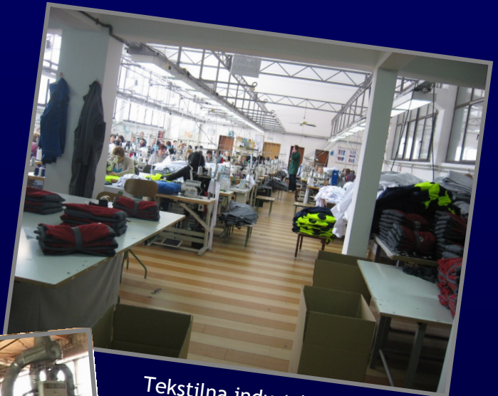
Tekstilna industrija / Textil industry