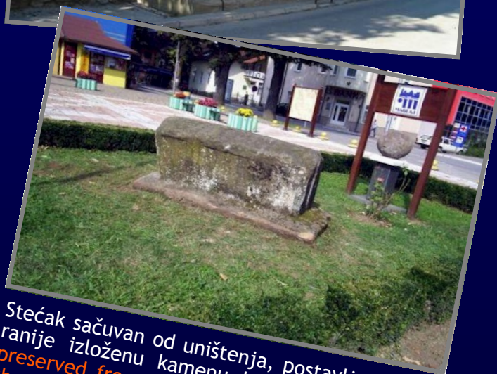
Stećak sačuvan od uništenja, postavljen je uz ranije izloženu kamenu kuglu / Tombstone preserved from destruction is located next to the previously exposed stone ball